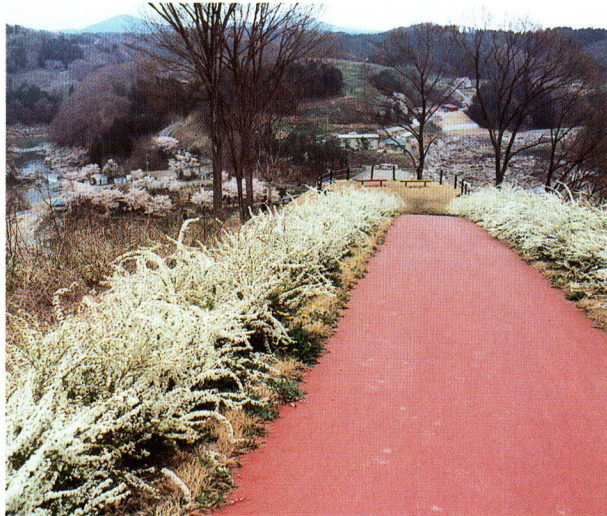
▲稚児舞台公園（見晴し台）