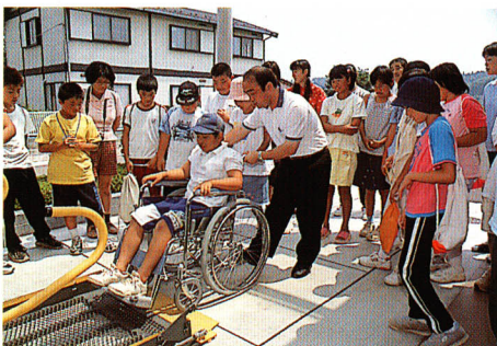
▲ボランティア講座

総合的な対策を図っています。 児童福祉 の推進は、町独自の児童育成計画（エンゼルプラン）に基づき地域全体での子育て支援や学童保育など保育体制の充実を図っています。 障害者（児） 福祉や低所得者福祉の推進、国民健康保険の充実、人権の尊重を図りながら、全ての人々が明るく健やかに暮らせるまちづくりを目指します。