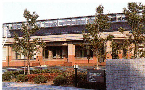
▲保健福祉センター

健康な体は、充実した人生を送るために大切な条件となります。「自分の健康は自分で守る」というセルフ・ケアの自覚と実践を基本に、町では、生涯を通じての健康対策と疾病に応じた予防対策を進め、総合的な健康づくりを推進しています。