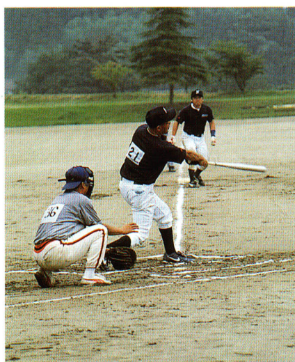
▲300オフトボール大会

健 康で心豊かな人づくりを目指して、スポーツ・レクリエーションの振興にも、積極的に取り組み、施設の整備も促進しています。