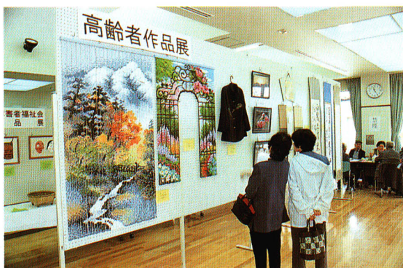
▲安達町文化芸術発表会

未 来を担う子供たちの健全な成長は、私たちの大きな願いです。町では、個性に富み、人間性豊かな児童・生徒の育成を図るため、幼児教育、学校教育の充実を図っています。学校教育では、幼稚園、小・中学校の施設や体制の充実とともに、外国人指導助手による学習や、コンピュータの導入など、国際化や情報化教育の充実を図っています。また、より豊かな人生を送るため、生涯にわたって自ら学習しようとする町民の要望に応えるための生涯学習環境の整備にも力を注いでいます。