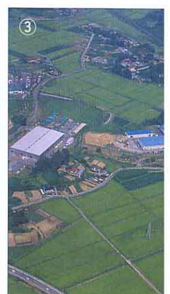
▲工場が集まっているところ