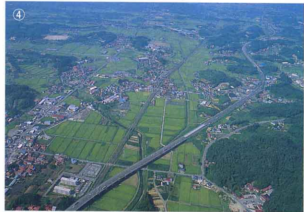
▲水田の多いところ