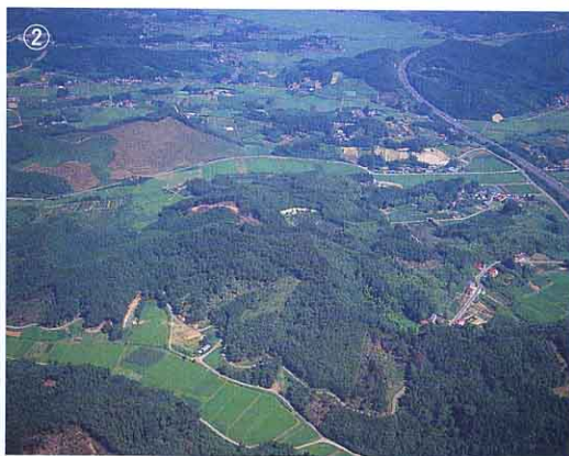
▲みどりの多いところ