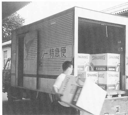
▲出荷 (国内や外国へ送り出す) [福島タチカラ(株)]