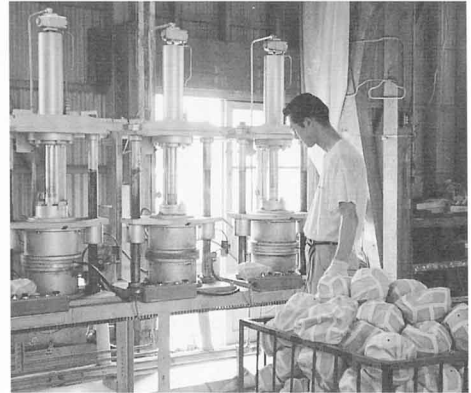
▲加硫 (成形・ボールの形をつくる)