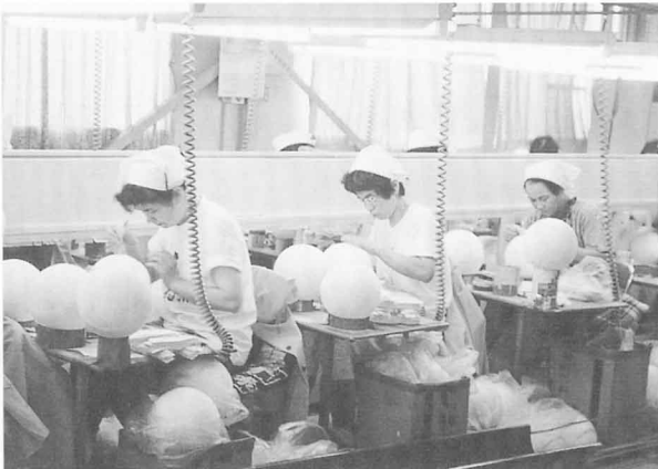
▲皮はり (1まいずつ皮をはりつける)