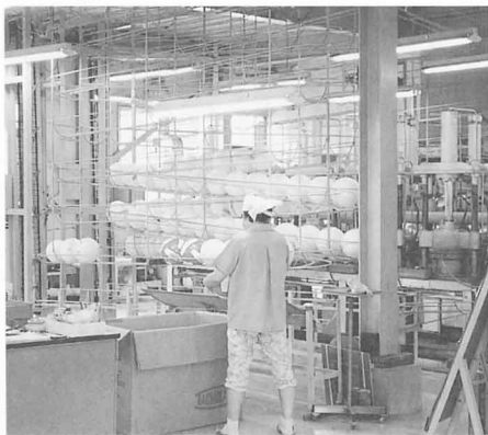
▲品質けんさ (不良品が出ないようにけんさする)