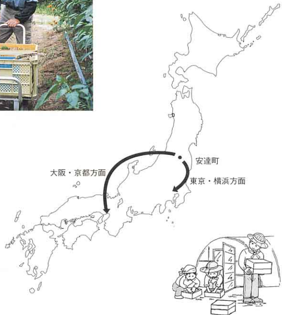
ピーマンの仕事ごよみ