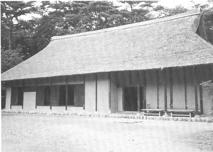
▲むかしの農家（江戸時代の頃） 1984年（昭和59年）に復元されたもの