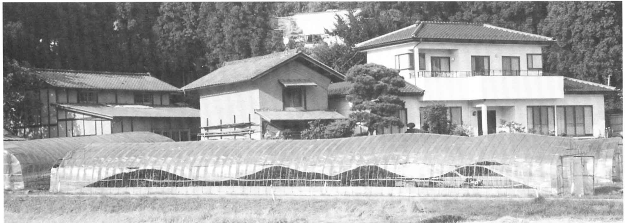
▲今の農家 1993年（平成5年）