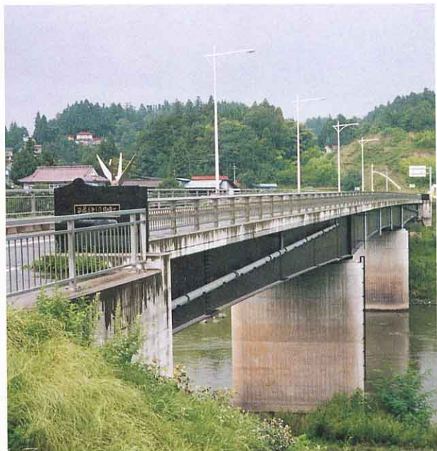
▲1992年10月（平成4年）智恵子大橋完成