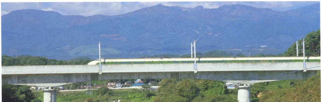
▲1982年（昭和57年）東北新かん線開通