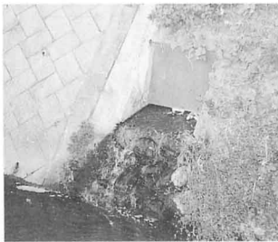
▲家庭からのはい水