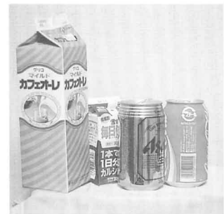
▲さい利用されるもの