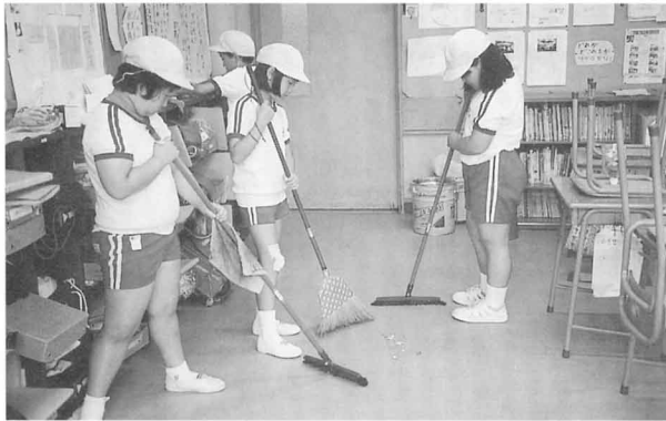
▲どんなごみが出るかな

●むかしは、ごみをどのようにしてしまつしていたのでしょうか。インタビューしてみましょう。