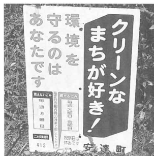
▲ごみしゅう集場所