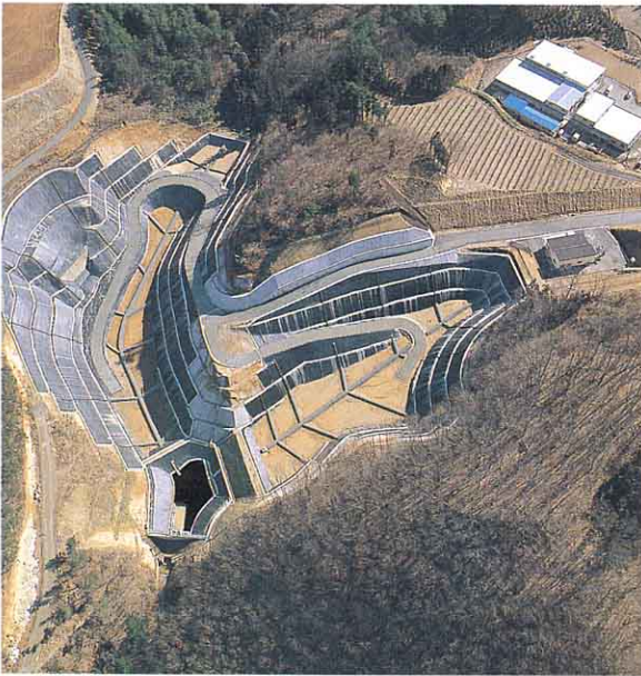
▲うめ立てしょぶんじょう