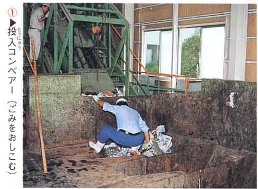
① 投入コンベアー (ごみをおしこむ)