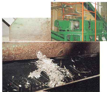
④ ▲ 減容固化機 (プラスチックなどを熱でやわらかくする)