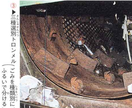
③ ▶ 三種選別トロンメル (ゴミを種類別にふるいで分ける)