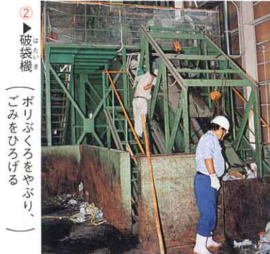
② ▶ 破袋機 (ゴミをひろげる)