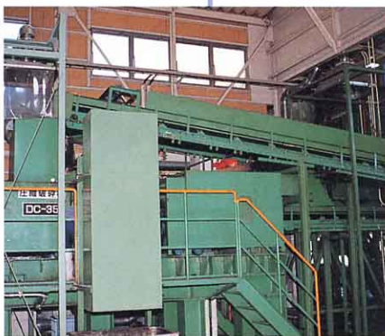
⑤ ▲ 圧縮破砕機 (プラスチックなどをすりちぎる)