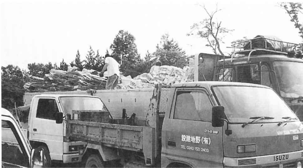
▲▼はい品回しゅうの様子