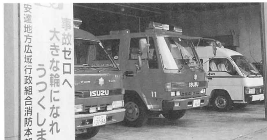
▲いつでも出動できる消防車