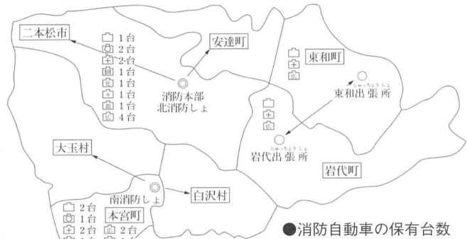
●消防自動車の保有台数