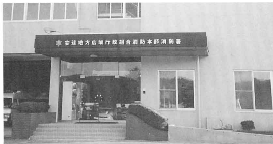
▲消防本部北消防しょ