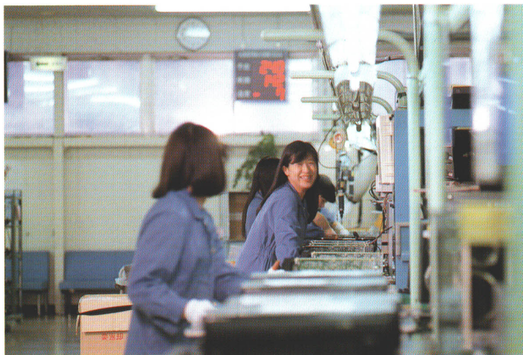
●明るく活気あふれる工場内

工業の振興は安定就労機会を作り、村内の経済基盤を確立するためにも、確かなビジョンを持って取り組まなければなりません。既存の企業を育て、強化するとともに、恵まれた交通条件を十分にいかし、農業生産環境を考えた、新しい工業団地の造成と、企業誘致を進めながら、地域工業の技術力の向上、地場産業の育成に力を注いでいきます。