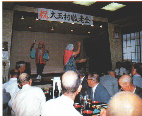
●和気あいあい、大玉村のお年寄りはいつも元気いっぱい。

赤ちゃんからお年寄りまで、すべての人が公平に、健康で安心して暮らせる村であるためには、福祉と医療のしっかりとした体制づくりが必要です。保健センターを拠点に乳幼児から高齢者にいたるまで各種検診を実施しながら、健康管理・指導をくり返し行っています。