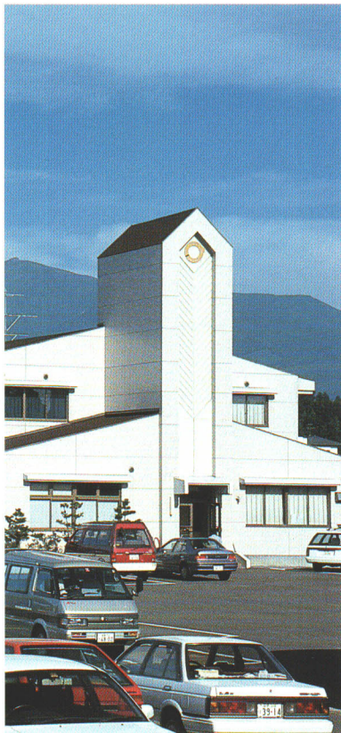
●保健センターは村内の健康推進活動の拠点