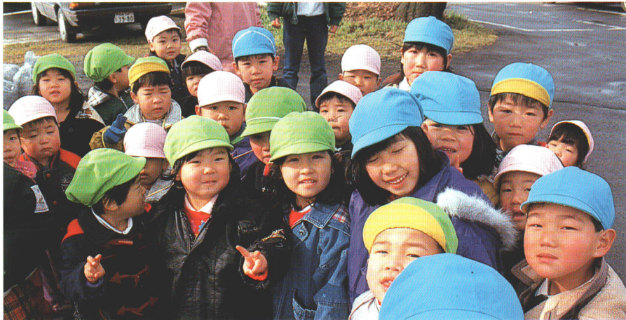
●元気で明るい大玉村保育所の子供たち