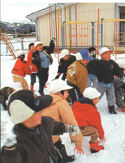
●雪の中でも負けずに元気な大山幼稚園児