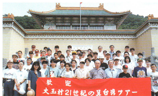
●21世紀の国際社会へ向けて見聞をひろめる

生涯学習や地域に住む人々の親睦・交流といった社会教育事業も時代とともに重要なものとなりました。文化的活動のための施設や集会所の建設、ふるさとの伝統を伝え残す催しの開催。国際感覚を養う海外交流。さらに健康促進と村内競技のレベルアップをめざす各種スポーツ大会の開催、および施設の建設など、ハードとソフトの両面から、世代を越えた新しい結びつきを応援しています。