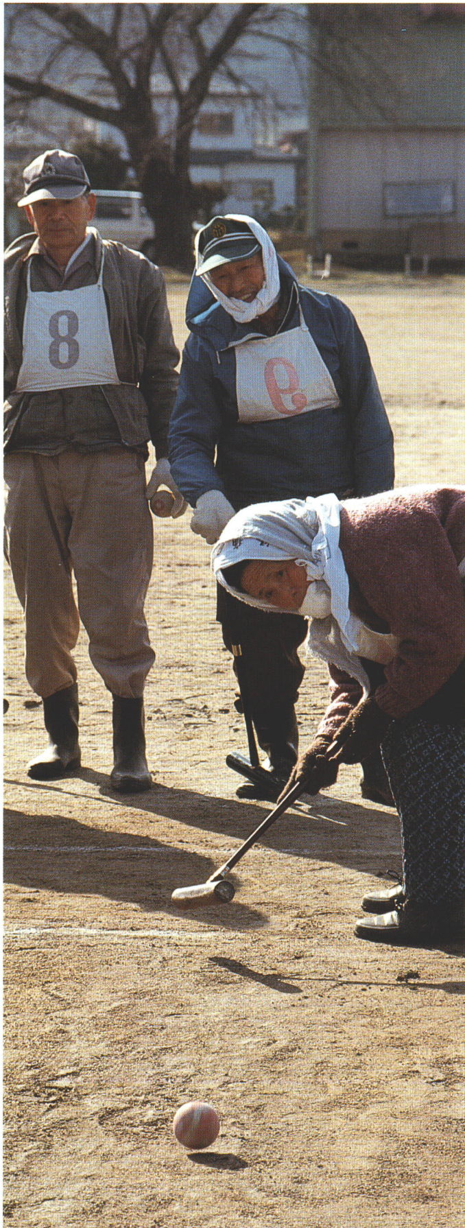
●元気なお年寄りの熱気あふれるゲートボール大会