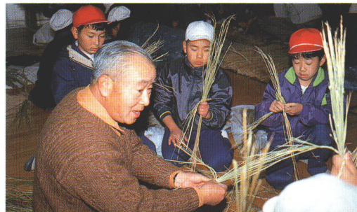
●ふるさとの伝統、しめ縄づくりを学ぶ