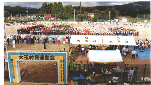
●いろいろな催しにも幅広く利用できる 村民運動場