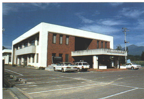
●文化活動の基地-農村環境改善センター