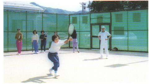
●全天候型人工芝コートが3面、 ナイター照明付き村民テニスコート