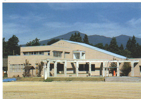
●あだたらふるさとホール(歴史民俗資料館)