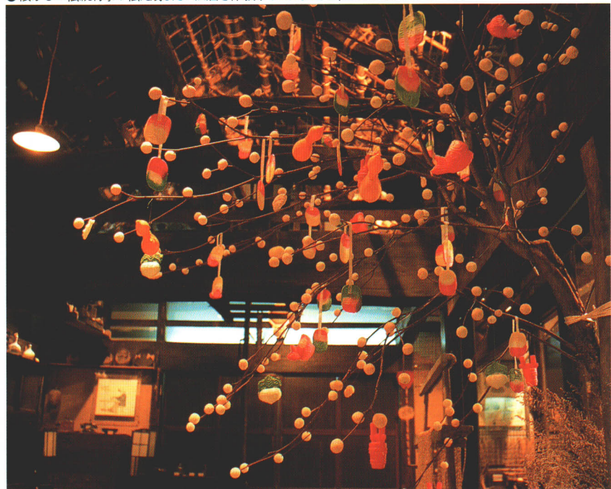
●懐かしい伝統行事や伝え残したい風習を体験することもできる(あだたらふるさとホール)