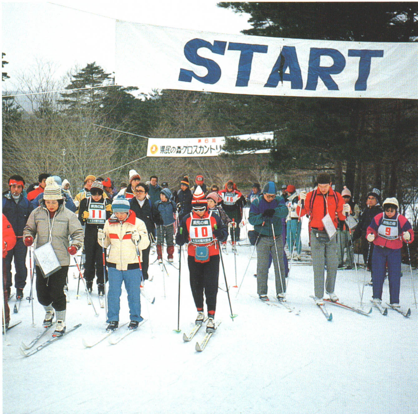
●2月には大会も開催するクロスカントリースキー