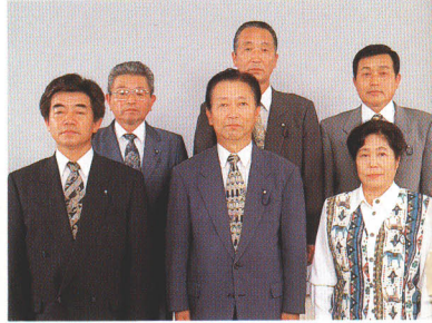
●厚生文教常任委員会