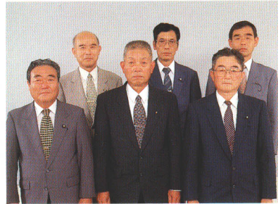
●産業建設常任委員会