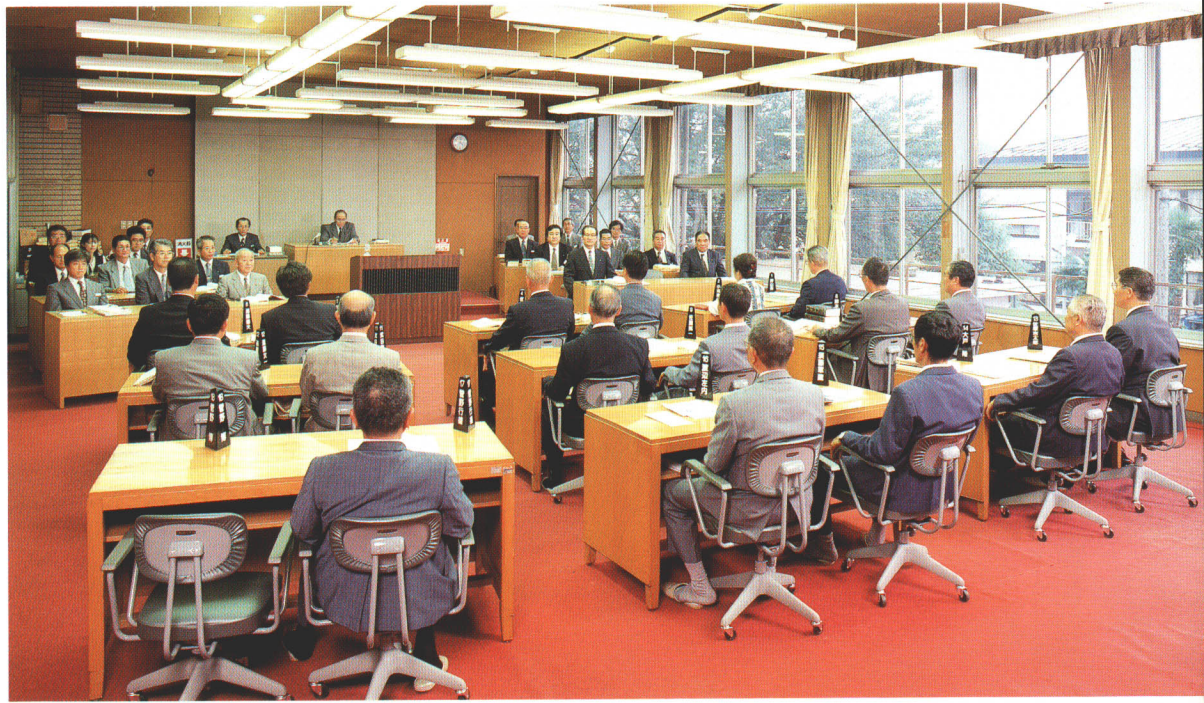
●村の発展を考えながら慎重に審議する村議会