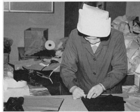
(ほうせいじゅんぴ)