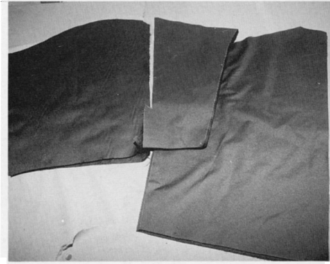
(さいだんされたもの)