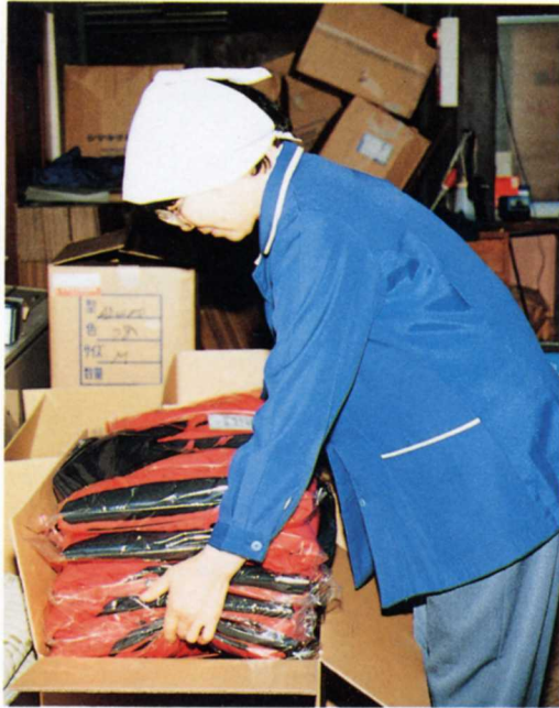
(せいひんのはこづめ)