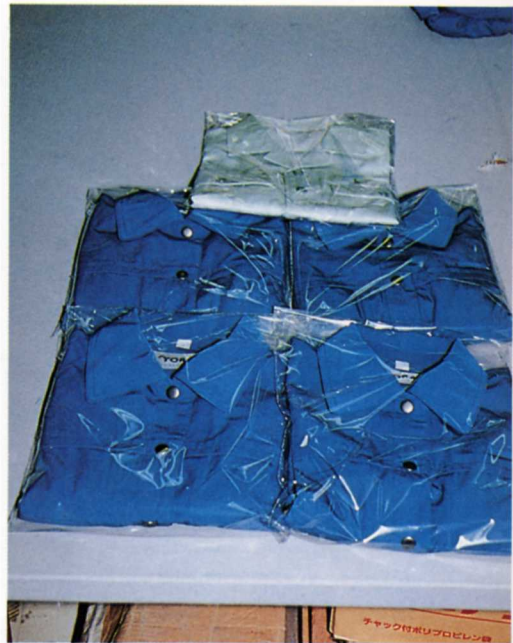
(しあがったせいひん)