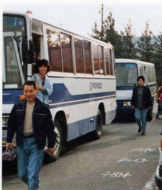
(はたらきにくる人びとのようす)