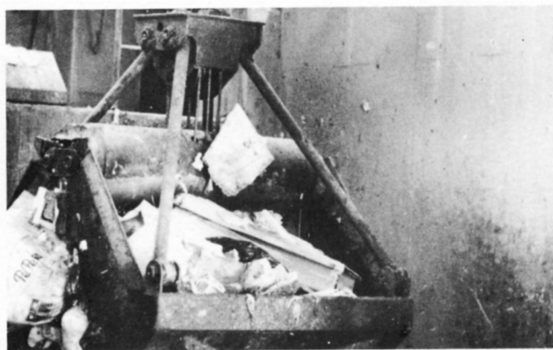
(クレーンでつりあげたようす)