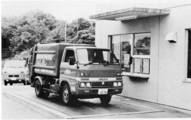
(重さをはかっているごみ収集車)