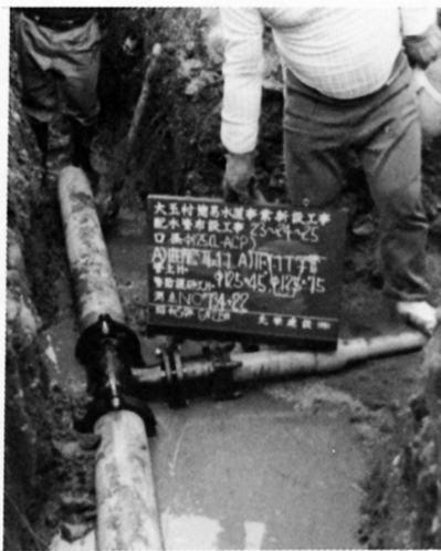
(水道工事のようす)