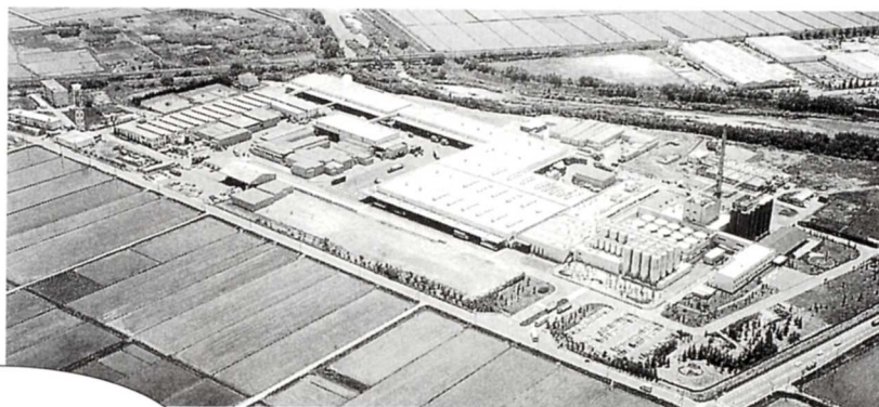
ぞうせつ前の工場 1986年