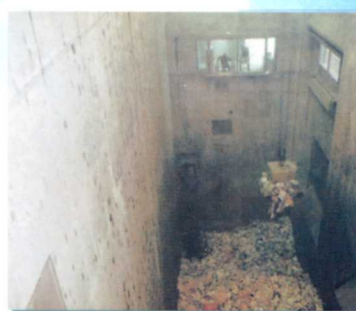
③ ごみピット・ごみクレーン操作室 操作室から遠隔操作で、ごみピット内のごみを攪拌後、ごみホッパへ投入します。