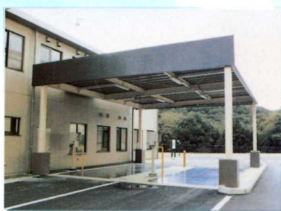
① ごみ計量機 収集した「ごみ」をここで自動的に計量・記録します。