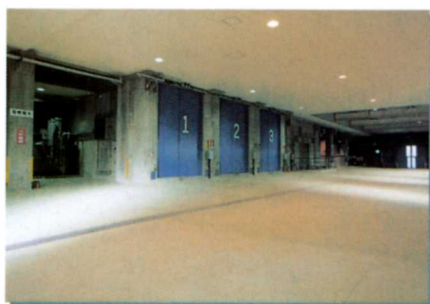
② プラットホーム 収集車が搬入した燃やせるごみをここからごみピットへ投入します。