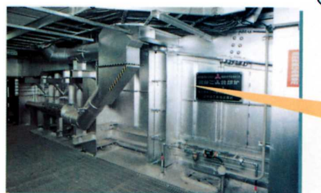
④ 焼却炉 「ごみ」はこの焼却炉で完全燃焼します。