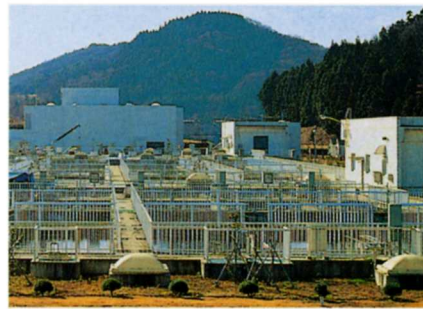
浄化センターのたてもの

このしせつは、 あぶくまがわ 阿武隈川流いきの市町村が、川の水をよごさないように、自然を守るためにつくったものです。