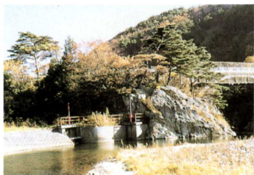
岩色疏水のせき場（輪が淵）