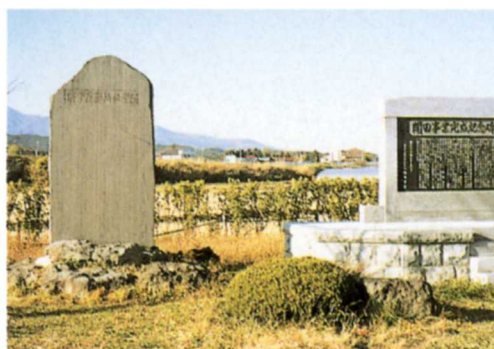
青田原開発記念ひ