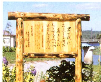
あぶくま川の歌をよんだかひ