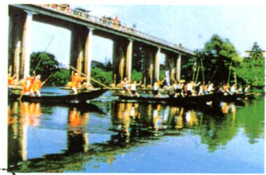
舟こぎきょうそう