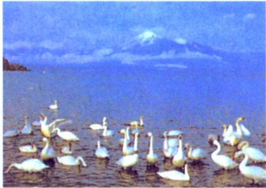
磐梯山と猪苗代湖