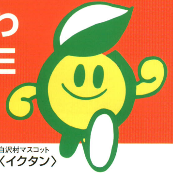
白沢村マスコット 〈イクタン〉