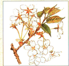
●村の花：やまざくら● the village flower : wild cherry tree