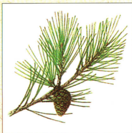
●村の木：あかまつ● the village tree : red pine