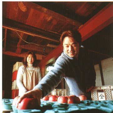
特産のりんごは宝石にも勝る輝き。

基幹産業である稲作をはじめ、大地と自然がもたらす恵みがこの町を支えているのです。