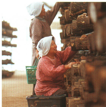
自慢のしいたけを収穫。