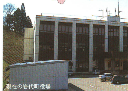
現在の岩代町役場