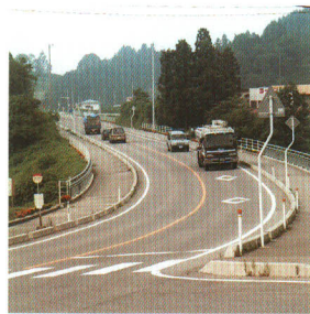
国道459号新殿バイパス

「豊かな活力ある健康な住民参加の町づくり」これは、岩代町が掲げる町づくりの基本姿勢です。阿武隈の山並みに抱かれた、自然豊かな美しい町。私達は先人から受け継いだこの町を大切に、心豊かな人間性を育み、活力ある町づくりを実現していかねばなりません。