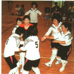
コミュニティスポーツ大会