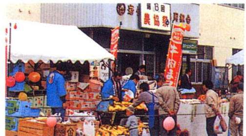
JAフェスティバル (農協祭)