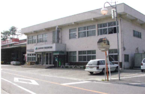
JAみちのく安達岩代支店