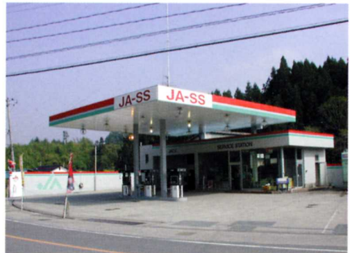
ガソリンスタンド