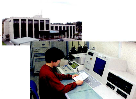
こうほう むせんしつ 役場広報無線室

*119番にかかってきた火事の通ほうは、すぐに消防署(岩代出張所)にれんらくが行きますが、同時に役場の こうほう むせんしつ 広報無線室にもれんらくが入り、サイレンやかく家庭のスピーカーから ほうそう 放送があり、消防団の人たちも火事の げんば 現場にかけつけます。