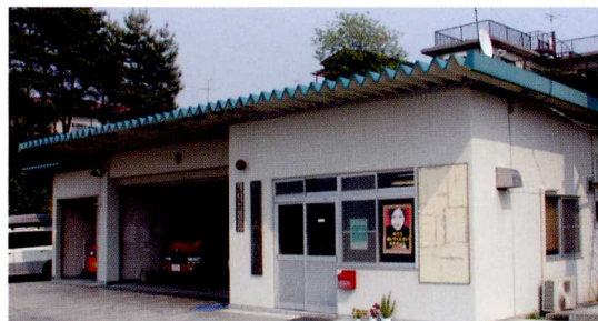
しゅつちやうじよ 岩代出張所