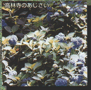
高林寺のあじさい