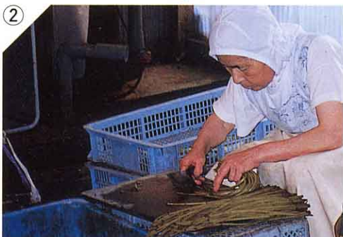
② 材料を せんべつ 選別する。