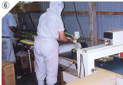
⑥ ほこ箱につめ出荷 する。