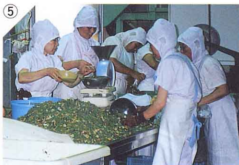
⑤ ふくろ 袋につめる。