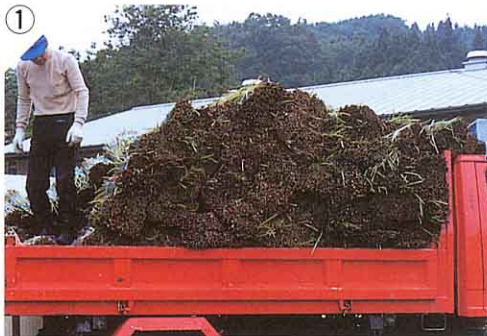
① ざいりょう 材料を工場へ はこぶ。