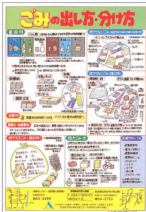
ごみの分別をよびかける ポスター