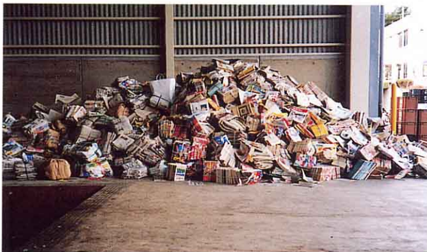
古新聞・古ざっしは東京などの工場へ送られ、再生紙 さいせいし の原料として利用される。