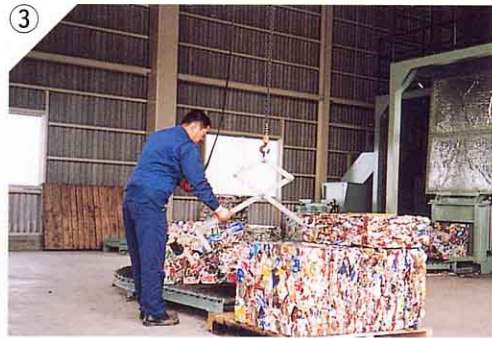
東京などの工場で、鉄こつやアルミサッシの原料にする。