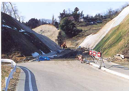
山を切り開いて道路をつくる（木幡）