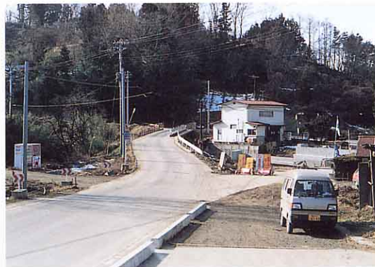
橋をかけ直す（木幡）