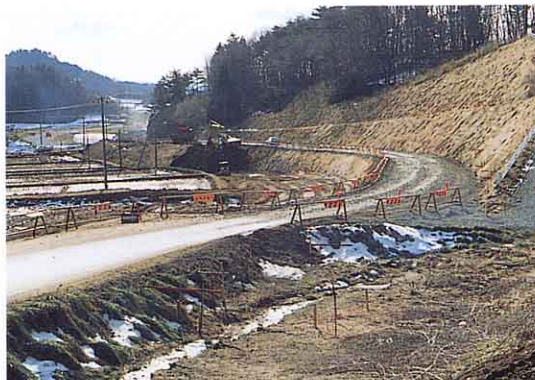
道のはばを広げる（針道）