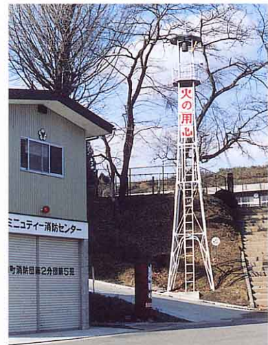
消防団とん所 近くにあるかな。