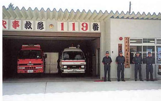
北消防署東和出張所