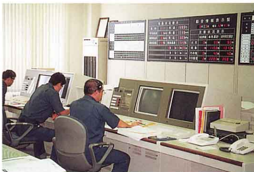
通信司令室 (消防本部)

※正しくは「安達地方広域行政組合 しょうぼう 消防本部」といいます。安達地区の7市町村が協力し合って、火事から安全な暮らしを守っています。