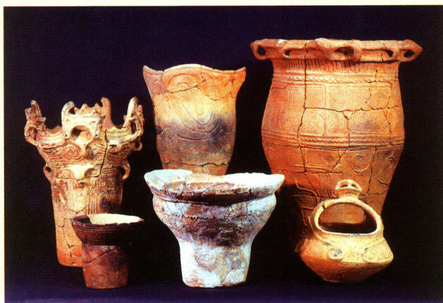
西田町・野中遺跡等から出土した土器