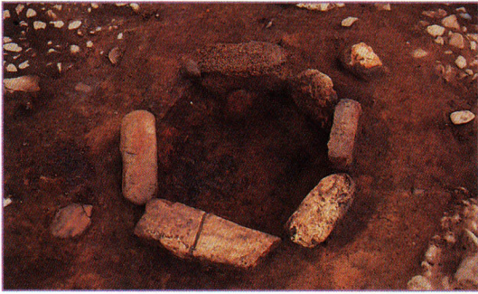
3800年前 町B遺跡「炉」(西田町)

あけび・ぶな・しい・くるみ・ くり・かや・きのこ・しか・い のししを食べてたんだよ。