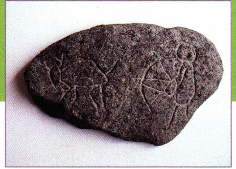
山ノ神遺跡出土 やまのかみいせき (湖南町)