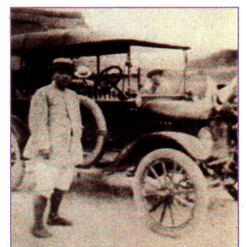
① 大正時代の自動車