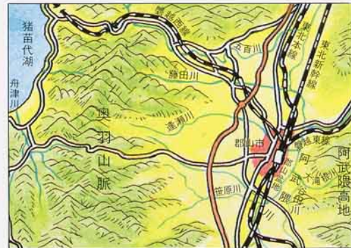
郡山市の土地のようす