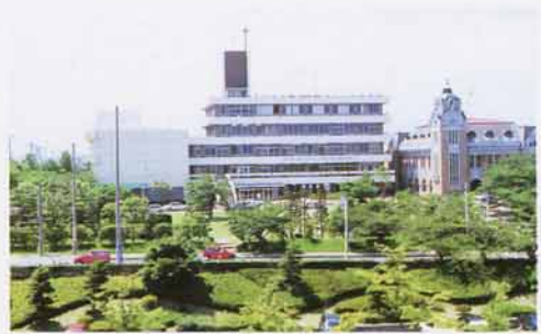
みんなの利用する建物の多いところ