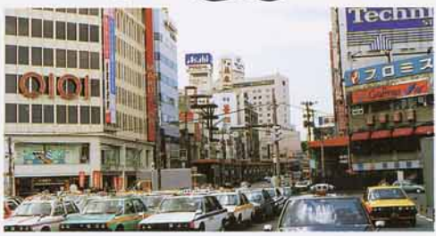
商店の多いところ

「駅前から西へむかう大通りや、きゆう国道には、大きなデパートやいろいろな商店があるね。」