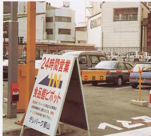
えきまえ 駅前のちゅう車場