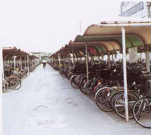
市のちゅうりん場