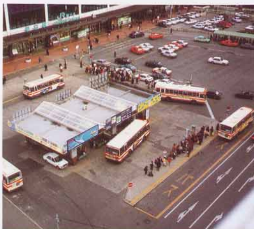
えきまえ 駅前のバスターミナル