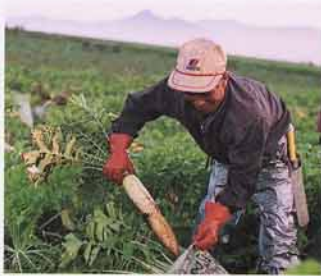
しゅうかく(午前3時から)