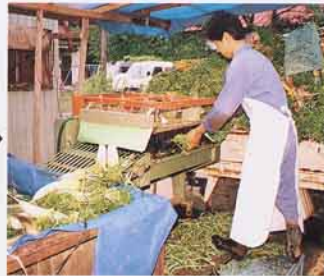
だいこん あら 洗い