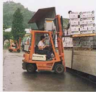
だいこんをつんだトラック

農家の人は、自分の家でだいこん あら を洗い、だんボールにつめて、農協 のうきょう に午後3時までにもっていきます。毎日、午後5時になると、何台ものトラックが、東京などに向かって出発します。市場 いちば がはじまる前に着かなくてはなりません。